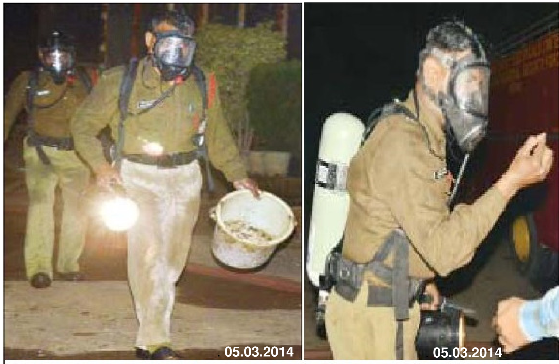
CISF personell approching the site after the water curtain was established and reporting the size of the hole in the Cylinder

Photographs taken by a photojournalist of a local News paper on the Night of 5th march'2014