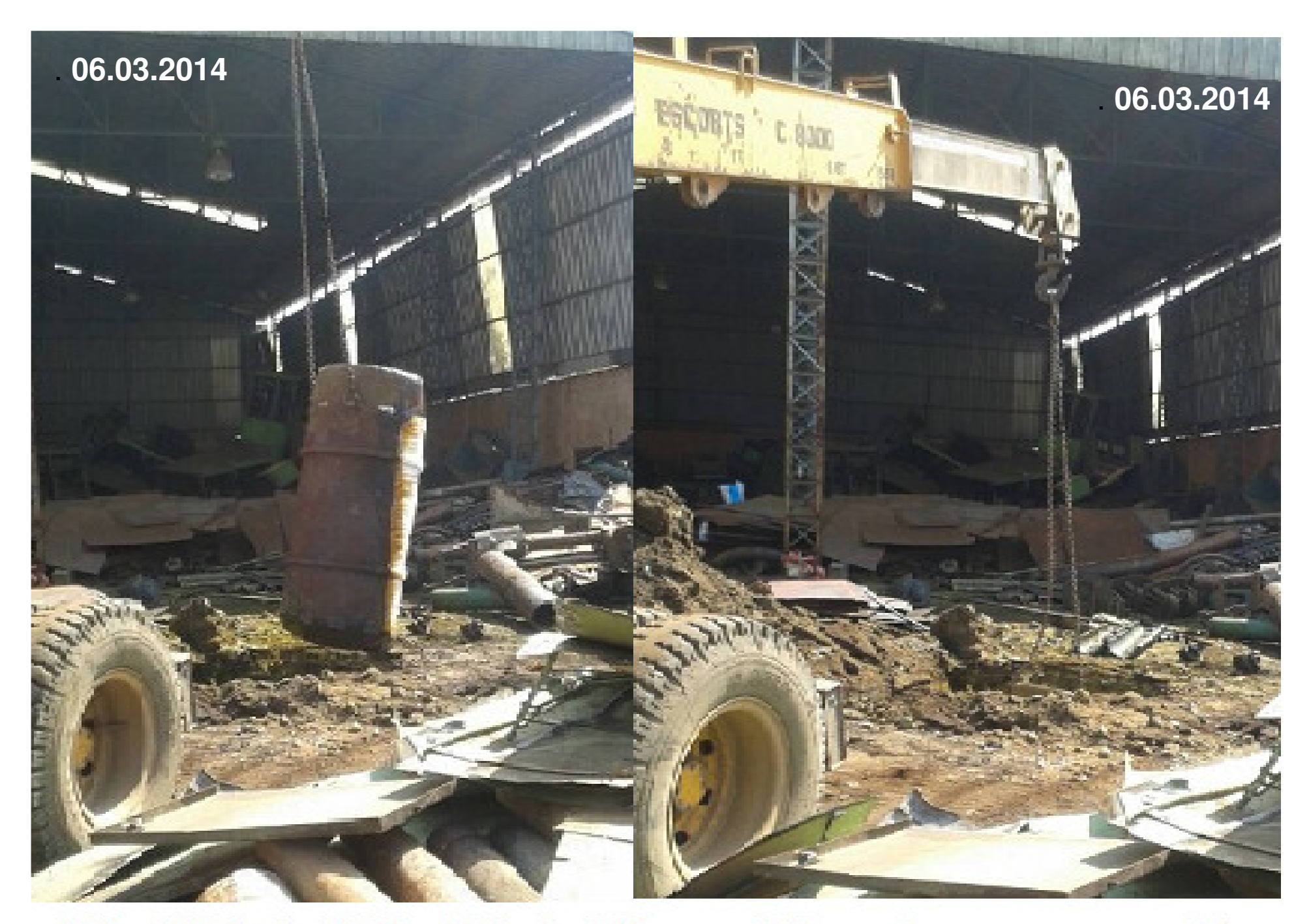
The Cylinder being lifted & lowered in to the temporary Pit