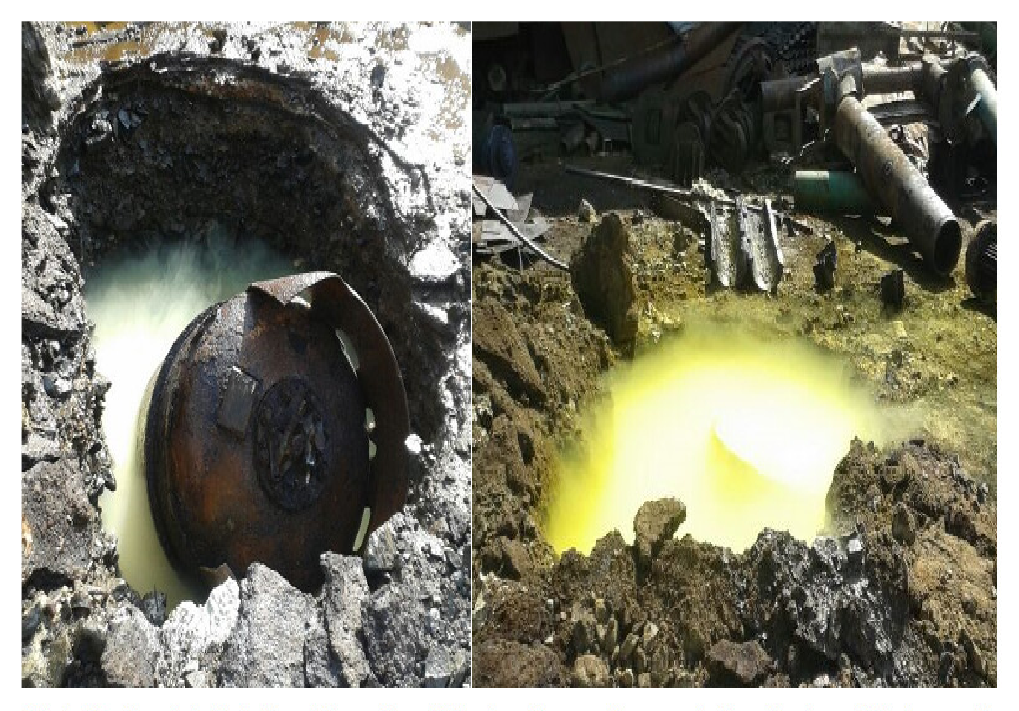
Nutralization is initiated and the yellow Chlorine Gas can be seen in the pit when pH is lowered