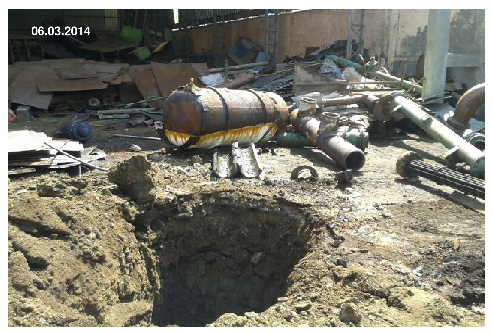
A pit was dug near leaking cylinder on 6th March to attempt Neutralization of Chlorine gas The cylinder that was pegged on earlier night. the ice formation on cylinder may be seen